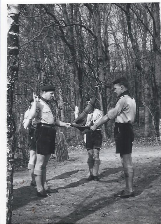
Inspectie van het uniform